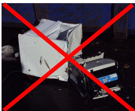
Fehl befüllter Container: Elektronik – Schrott im Sperrmüll

Achtung: Die Abfallbehältnisse müssen transportfähig sein und dürfen nicht mit Teilen, die weit über das Behältnis ragen, beladen werden.