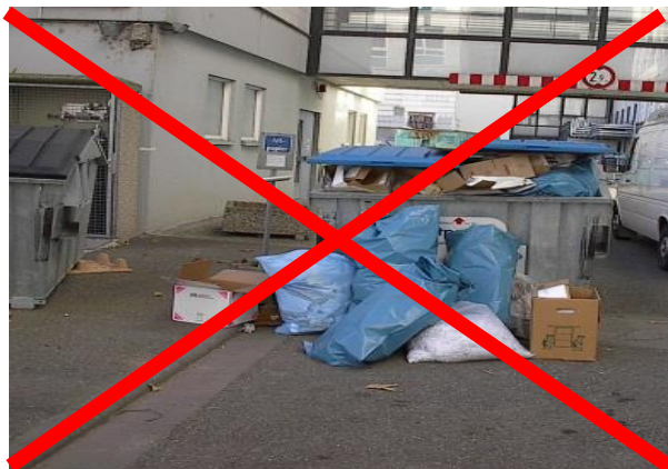
fehl- und überfüllte Mulde

Noch Fragen zum Thema Entsorgung von Hausmüll ? Das Entsorgungs-Center beantwortet Sie Ihnen gerne!